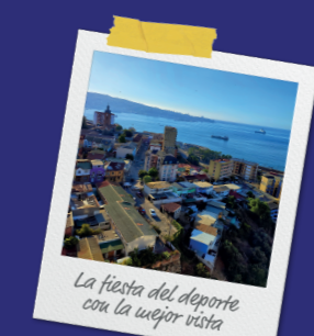
La fiesta del deporte con la mejor vista